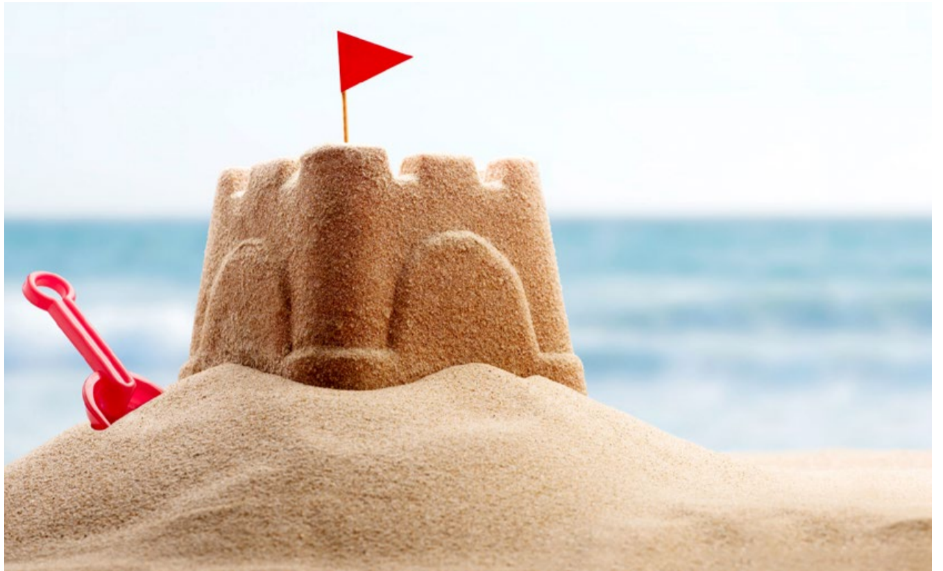
Feinster Sand aus der dänischen Südsee

Heiligenhafen – Und plötzlich war ein neuer Strand da. Viele Gäste und Einheimische staunten nicht schlecht über das, was sie da an der Nordseite des Binnensees entdeckten. Mit feinstem Sand aus der dänischen Südsee ist Ende September ein weiteres Highlight entstanden, das nun bald zum Spazieren und Verweilen einlädt. Am Ende wird eine 800 Meter lange Strandlandschaft mit diversen Freizeitmöglichkeiten entstanden sein. Große so genannte Hopperbagger hatten den Sand in Gewässern vor den dänischen Insel Aero und Langeland aufgesaugt und ihn dann 54 Kilometer weit an den Heiligenhafener Steinwarder transportiert. Mittels eines riesigen Spülrohrs, das Unmengen des Sand-Wasser-Gemischs an die Küste schoss, entstand