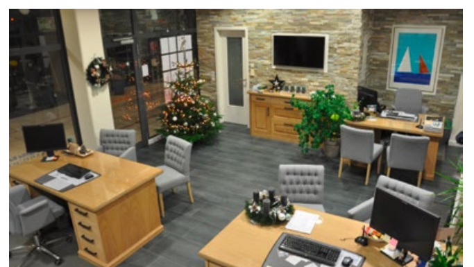
Nach 10 Jahren gabs einen neuen Look in unserem Vermietungsbüro