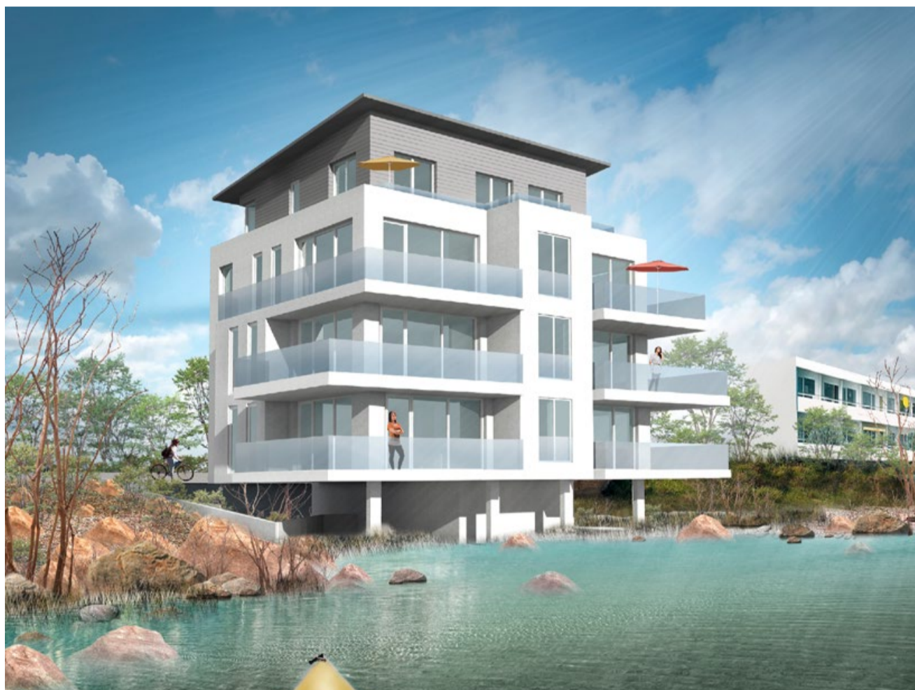
Geplante Ferienwohnungen, Steinwarder 21

Die Ferienwohnungen wiederum bieten ebenfalls eine freien Blick aufs Meer - entweder vom Balkon oder der Dachterrasse. Sie sind zwischen 75 und 120 Quadratmeter groß und fügen sich wunderbar harmonisch in das gesamte Ensemble Dünenpark ein. Nicht nur rein optisch suchen die weitgehend quadratischen Strandvillen mit ihren klaren Linien ihresgleichen.