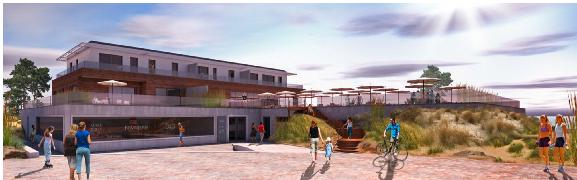
Gute Aussichten: Perfekte Lage der vier Ferienwohnungen mit einzigartigem Blick auf die Ostsee.

Heiligenhafen – Um es vorweg zu nehmen: Ja, die Firma Bünning hat die ehemalige Kiki-Bar erworben. Und nein, wir planen dort nichts Schlüpfriges. Im Gegenteil, sechs seriöse Ferienwohnungen mit einer Größe von 60 bis 110 Quadratmeter und jeweils zwei bis drei Zimmern sollen entstehen - und sind sogar bereits verkauft. Kein Wunder, denn inzwischen ist der Heiligenhafener Steinwarder bundesweit im Gespräch als DIE boomende Ferienregion an der Ostseeküste.